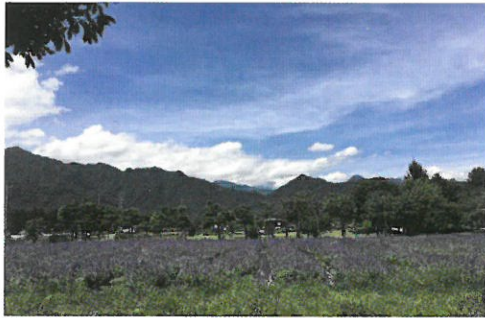
安曇野ちひろ公園