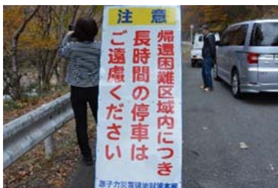
114号線に立つ掲示 こんな無理をしてでも開通？

毎時 5 ~ 10 \mu Sv ! 少なくとも妊婦と青少年は立ち入り禁止にすべきでは