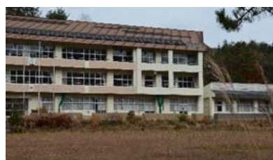
荒れ果てた津島中学校

「国道 114 号開通は復興のために必要だ、放射線量も下がった、住民も望んでいた」という事で開通したと言うのです。それは違います。どんなことがあろうとも住民の命と健康を第一に考えるとするならば、少なくとも妊婦、20 歳以下或いは 15 歳以下は通行禁止すべきと考えますが如何なものでしょうか？これまで何度も言っていますが、放射能に安全な値などないと考えるべきではないでしょうか