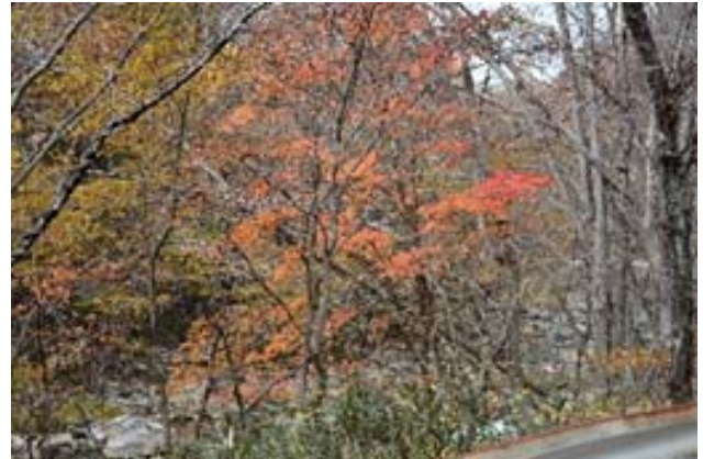
室原川上流 原発事故事故さえなければキノコとヤマメの宝庫なのに