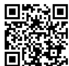
各フードバンク 紹介