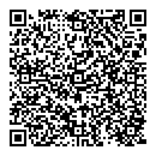
アンケートに ご協力ください