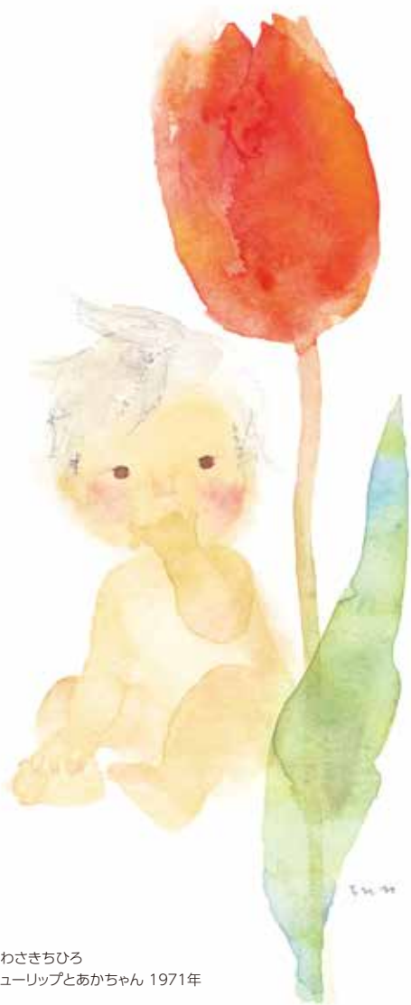
いわさきちひろ チューリップとあかちゃん 1971年

青春時代に戦争を体験したちひろは、「世界中のこどもみんなに平和としあわせを」という言葉を残しています。